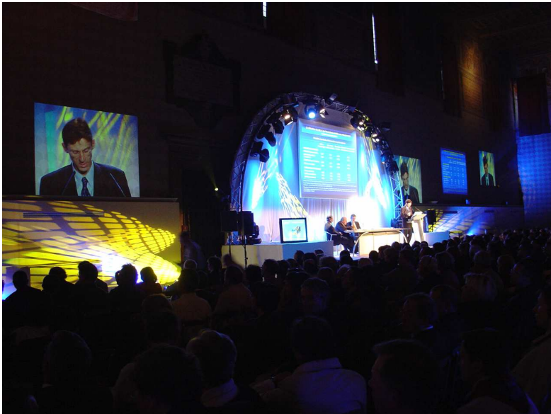
Evénements Publicis Rome & Paris